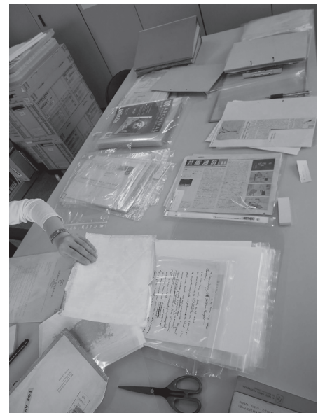
アーカイブ作業(2009年 慶應義塾大学アート・センター 西別館)