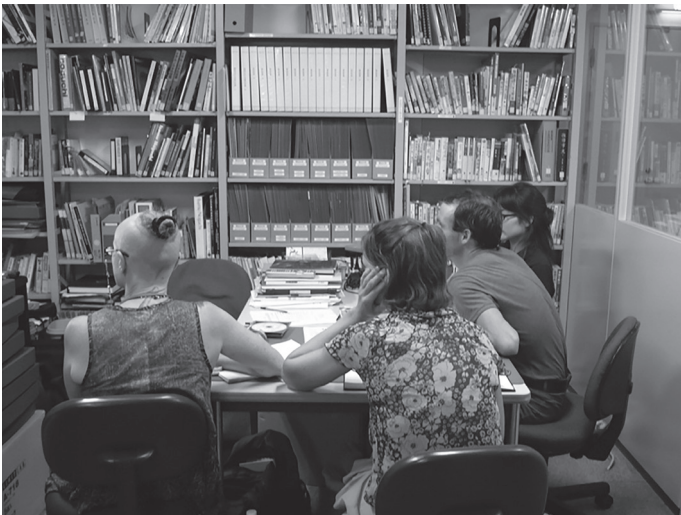
土方アーカイブの調査に訪れる海外からのリサーチャー(西別館時代)