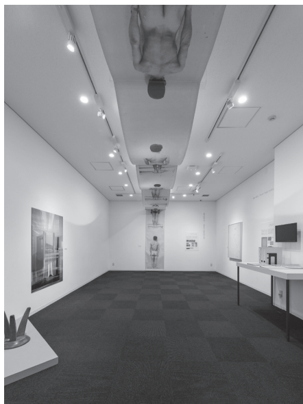
「我に触れよ(Tangite me):コロナ時代に修復を考える」展(2021年)