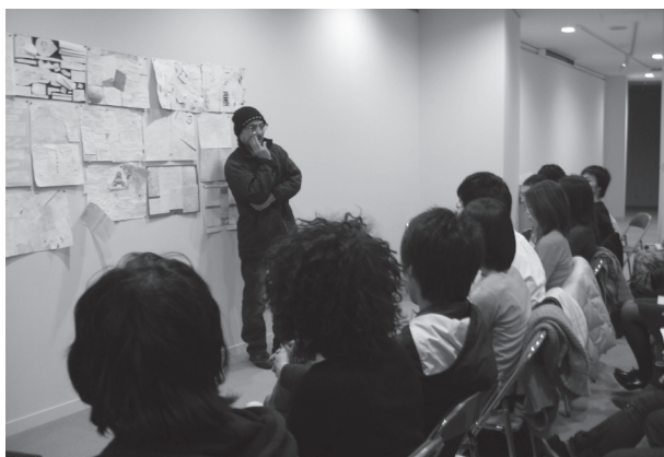
Artist in Campus 大竹伸朗 ワークショップ「スクラップ」(2007年)

小さいながらも、領域横断的な交流の場として、面白い出会いが創出され、行き会う場として、これからは創造的で、オープンで、そして、何より挑戦し続ける、そんな変わり種の研究所であり続けたい。