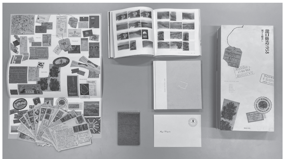
『瀧口修造1958 旅する眼差し』(慶應義塾大学出版会、2009年)の展開写真

ルのつけようのない、多様なものたちを包みこむ豊かな分野です。既存ジャンルを越境した活動の場合は特にそうなると思うのですが、表現者の仕事からより深く何かを読み取ろうとする時、「資料」にこそ重要な肉声、研究の鍵がひそめられていることは間違いのないでしょう。瀧口の初めての欧州旅行を資料で採りあげた大著『瀧口修造1958 旅する眼差し』(慶應義塾大学出版会、2009年)の豪華さとはびぬけていました。瀧口のメモ・ノート、ポストカードなどの精緻な再現、いえ再制作というべきでしょうか、その精度はマルセル・デュシャンの『グリー