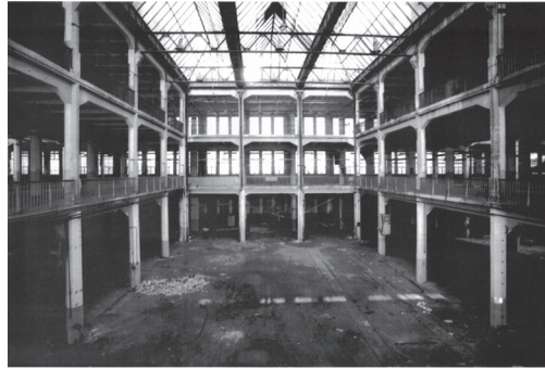
Fig. 2 ZKMが草創期の活動拠点とした元武器・弾薬工場