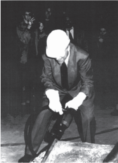
Fig. 1 ZKM起工式におけるハインリヒ・クロッツ、1993年