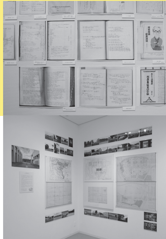
上:アート・アーカイヴ資料展I「ノードする4人—土方、瀧口、ノグチ、油井」(2006年) 下:アート・アーカイヴ資料展XXIII「横文彦と慶應義塾II:建築のあいだをデザインする」(2022年)