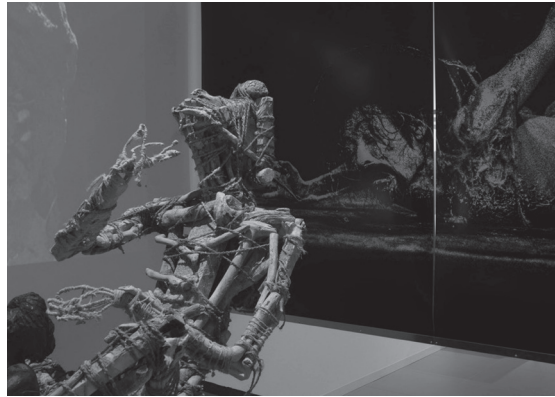
Fig. 3 「痲瘡譚～生んだもとの生命からすでに切りはなされてあるを」展会場風景 2022年7月