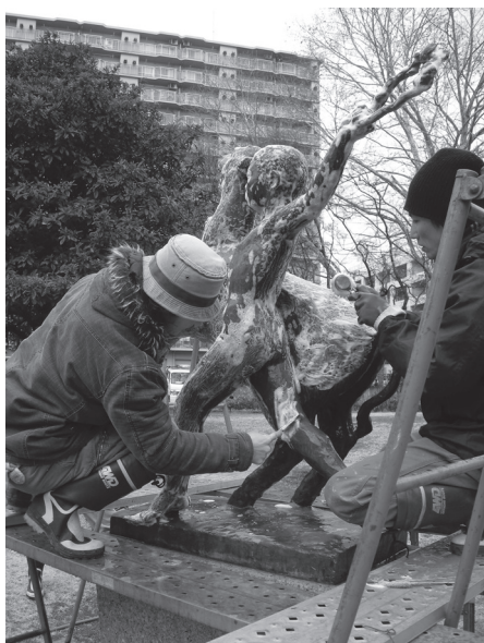
《牧童》(志木高等学校)の保存修復作業(2009年)