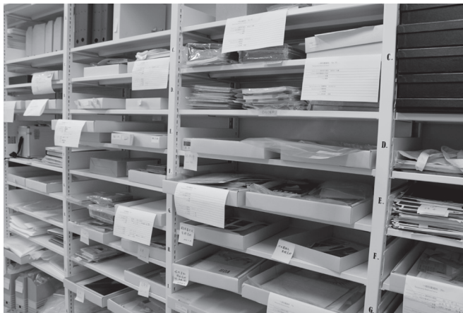
慶應義塾大学アート・センター収蔵庫(2017年)